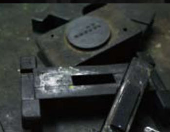
型入れ 墨を成形する木型。堅くて木目の少ない梨の木が使われる。