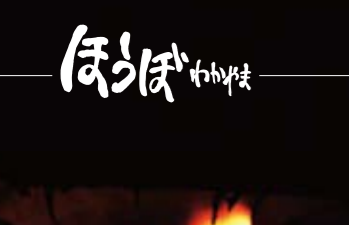
松煙焚き 細かく切った松をゆっくりに燃やすことで、煤が生じる。

江戸時代には「障子焚き」といい、障子で囲った小さな部屋の中で松を燃やすことで、障子にたまった煤を集める方法が用いられた。現在は、障子の代わりに目の細かい金網が使われている。