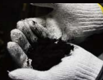
煤とり作業 とったばかりの煤は空気を含むため、ふわふわしてとても軽い。