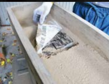
乾燥作業 灰は備長炭の炭がまからとれたもの。