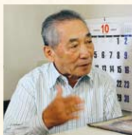
取材協力 平岡繁一氏

後白河院の熊野詣は永暦元年（1160年）に始まり、建久2年（1191年）まで34回に及んでいるが、このころに国司が献上するほどの出来であったということ考えると、1000年ごろには墨作りが行われていたのではないかと推測される。