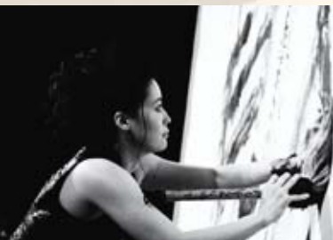
表紙の書：紫舟【シシユー】

書道家。六歳から書始める。書の本場奈良で三年間研鑽を積み、のち東京へ。NHK大河ドラマ「龍馬伝」をはじめ、外務省「APEC Japan2010」、ハリウッド映画「エアベンダー」やSUZUKIアルトCMなどに作品を提供。朝日新聞や読売新聞でも長く書の連載をもつ。海外では「パリコレ」への作品展示や国際会議での招待公演、国立現代美術館での展示など幅広く活動。書「龍馬伝」で第五回手島右衛門賞を受賞。