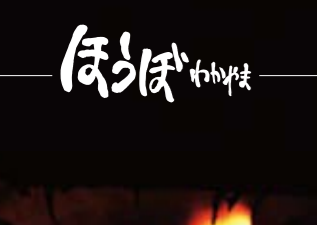
松煙焚き 細かく切った松をゆっくり燃やすことで、煤が生じる。

江戸時代には「障子焚き」といい、障子で囲った小さな部屋の中で松を燃やすことで、障子にたまった煤を集める方法が用いられた。現在は、障子の代わりに目の細かい金網が使われている。