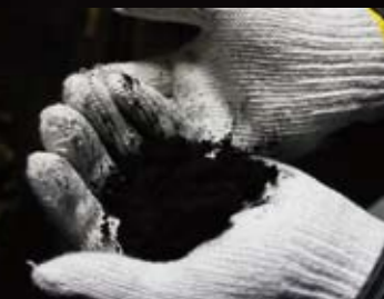
煤とり作業 とったばかりの煤は空気を含むため、ふわふわしてとても軽い。