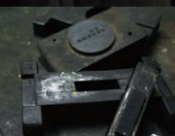
型入れ 墨を成形する木型。堅くて木目の少ない梨の木が使われる。