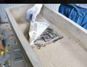
乾燥作業 灰は備長炭の炭がまからとれたもの。