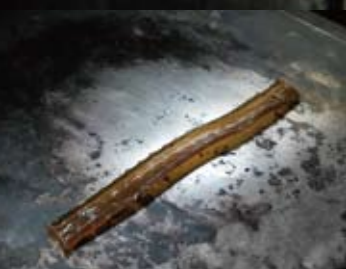
膠と練り込む 良質の膠。これを溶かして煤と練り合わせる。